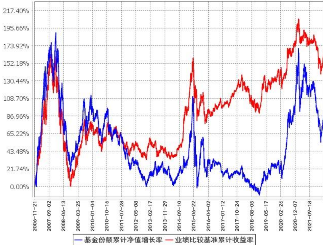
基金份额累计净值增长率与同期业绩比较基准收益率的历史走势对比图 (2006年11月21日至2022年6月30日)

注：1、根据本基金的基金合同第十一部分“基金投资”中“八、投资组合限制”的规定，本基金自2006年11月21日合同生效之日起六个月内为建仓期，建仓期结束时各项资产配置比例符合基金合同约定。